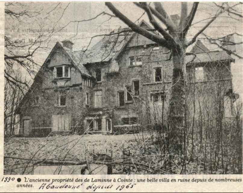
Article de presse de 1990, montrant la villa de Laminne à l'abandon.

RÉHABILITATION D'UNE FRICHE BOISÉE EN PARC RÉSIDENTIEL, AVEC UN PROJET D'ASSAINISSEMENT, LA DÉMOLITION DE RUINES, LA CONSTRUCTION GROUPEE DE 80 LOGEMENTS AVEC PARKING, ET REVITALISATION DU BIOTOPE