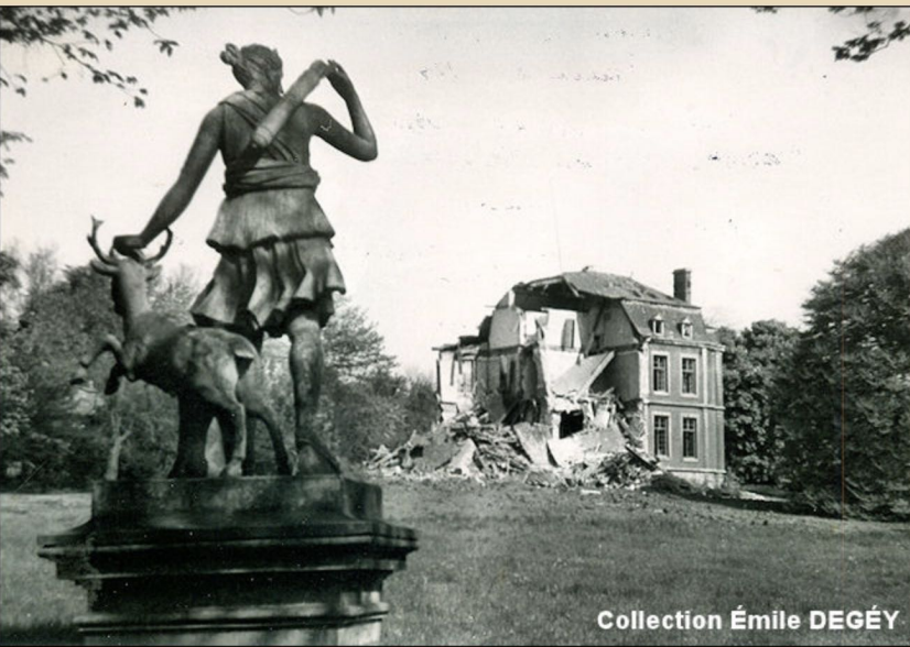
Cette vue représente le château de Laminne, au Bois d'Avroy, après les bombardements