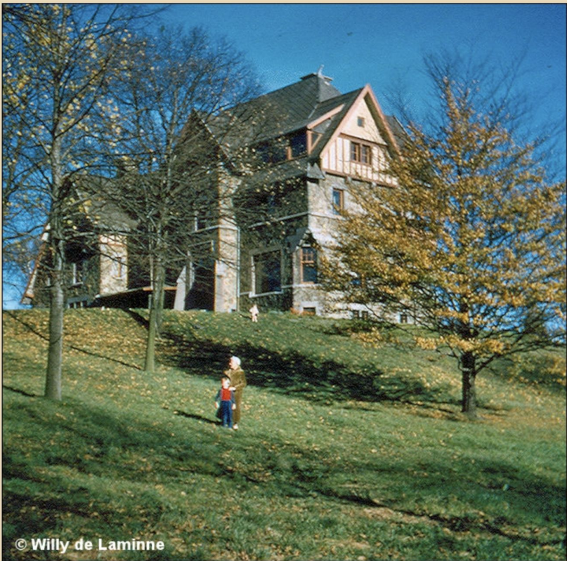
La villa de Laminne à la fin des années 1950.