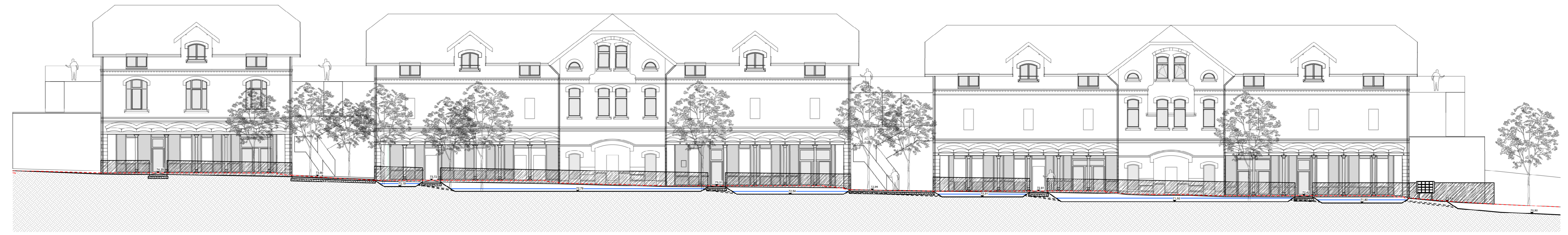
COUPE 3-3' échelle 1:200